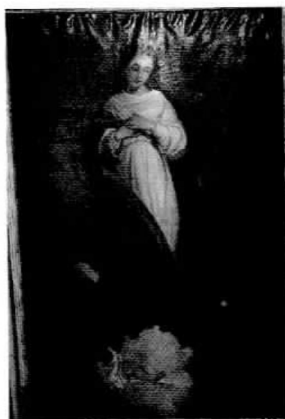
INMACULADA CONCEPCION (Escalera del Colegio de la Compañía de María de Jerez). Es clara la influencia de Zurbarán. Los pintores españoles del siglo XVII son reivindicados por los pintores del siglo XIX en sus cuadros religiosos. Necesita una urgente restauración.

Justa y Rufina (Castillo de San Marcos de El Puerto de Santa María y otro en el Alcázar de Jerez), Virgen del Rosario (realizado para el Tenis Club de Ecija), Cuadro de ánimas, San Pedro (colección particular, Jerez), Estandarte para el homenaje a Murillo en 1882 . 18 Sabemos que también realizó un alegoría del Sagrado Corazón de Jesús decorando la cúpula de la antigua Iglesia de la Compañía en Jerez, que se derrumbó en el siglo XX.