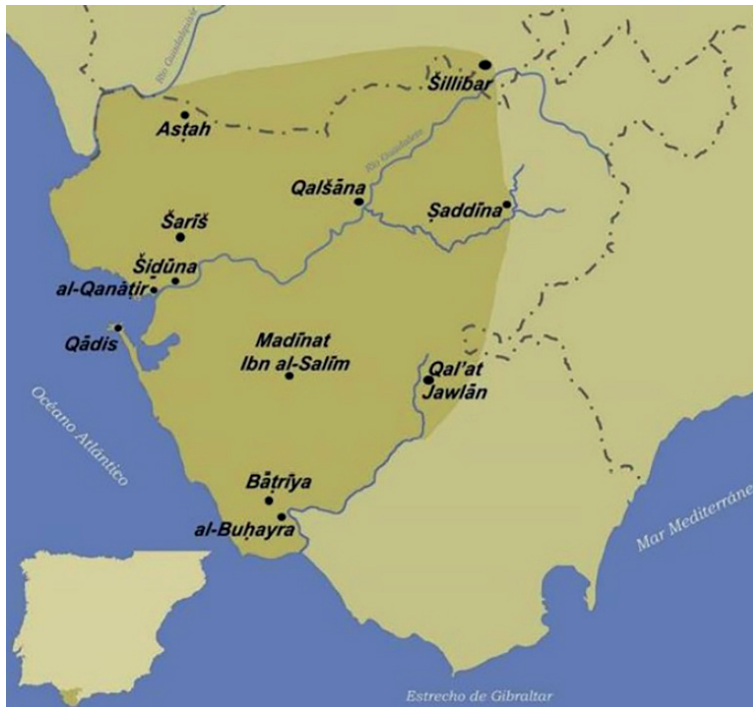
Fig. 1. Mapa de la cora de Sidonia sobre los actuales límites de la provincia de Cádiz (ss. VIII-X) elaborado por José M. a Gutiérrez López (en Borrego Soto, 2013, p. 40)

El nuevo rey, su hijo Alfonso X, no dudó en emplear cualquier fórmula que facilitara el anhelo de su padre, bien desde la conquista militar, bien con el quebrantamiento de las cláusulas recogidas en las pleitesías que Fernando III había firmado con los andalusíes. En los primeros años de su reinado, comenzó a preparar la campaña africana, continuando la construcción de las atarazanas de Sevilla, que se había iniciado en 1252 11 . En el año 653 (=1255-1256), y en relación con los preparativos de la Cruzada, el caíd Abū ‘Abd Allāh al-Randāyī era derrotado y muerto en el río Guadalquivir 12 . Las naves que se levantaban en Sevilla tenían por fin el camino expedito hacia la bahía gaditana, adonde llegaban en 1257 a la espera de partir hacia el norte de África 13 . Con las galeras y bajeles frente a Cádiz y las fortalezas de Arcos y su entorno en poder de los castellanos, Alfonso X preparaba el asalto a la plaza de Jerez, principal obstáculo para sus pretensiones sobre el valle del Guada-