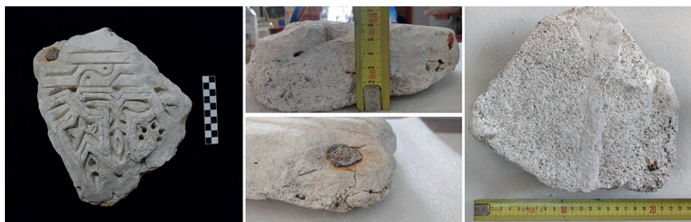
Figura 4. La pieza nº 1.

No se documenta capa de material entre ambos morteros, por lo que cabe la posibilidad de que haya sido tallado en la propia pared, utilizando una plantilla 6 .