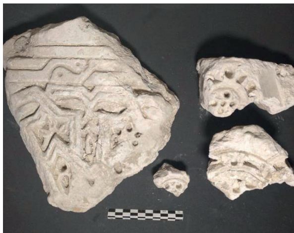
Figura 3. Las piezas, previamente a su limpieza.