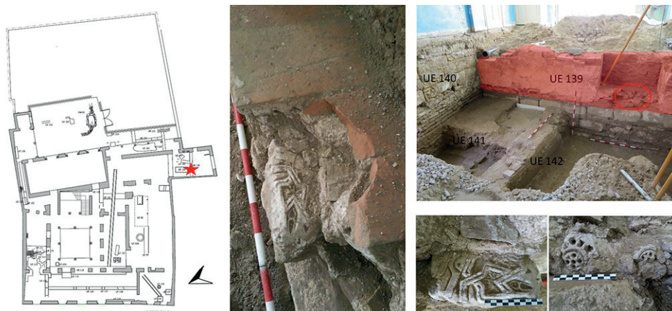
Figura 2. Lugar del hallazgo. Estado inicial.