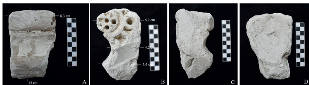
Figura 6. Pieza n° 3. A: Anverso. B y C: Laterales visibles. D: Reverso de contacto con la pared.

Se aprecia tan sólo decoración tallada de ataurique con parte de una roseta con incisiones. Presenta cierta curvatura, por lo que debe ser considerada una moldura que hay que relacionar con la pieza n° 3.