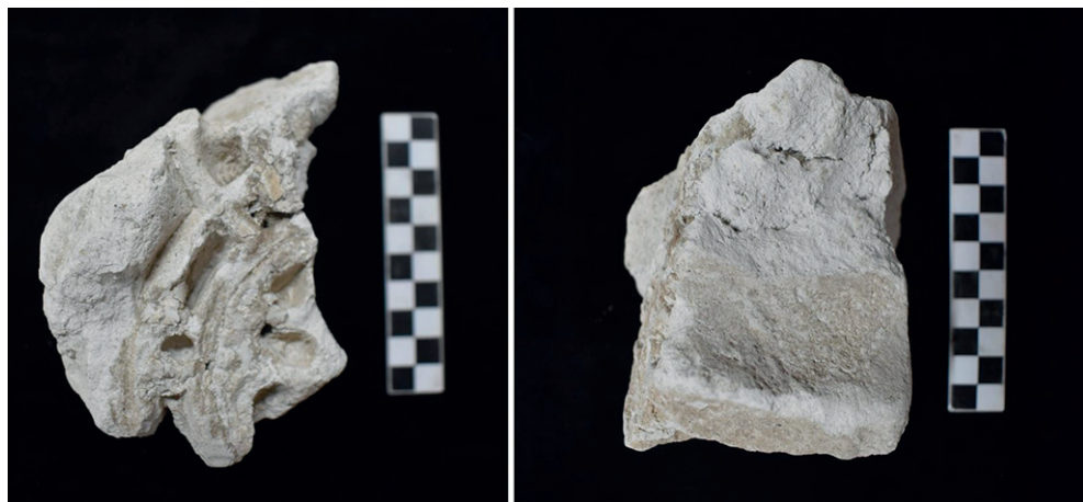
Figura 5. Pieza n° 2.