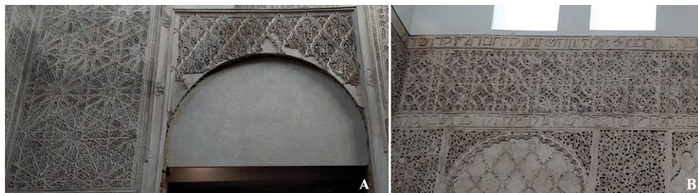
Figura 9. Sinagoga de Córdoba. Detalles del muro este (izquierda, A) y norte (derecha, B).

el momento en el aire, a expensas de los hallazgos que la arqueología pueda deparar en el futuro.