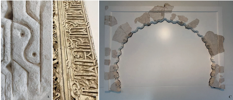
Figura 8. A la izquierda (A), el nudo jerezano; en el centro (B), el nudo cordobés. A la derecha, el arco del Alcázar de Jerez expuesto en el Museo Arqueológico Municipal (C).

te del Alcázar de Jerez 10 , y conservado en el Museo Arqueológico Municipal (Fig. 8:C). No obstante, en contraposición a éste, no conserva, si es que la tuvo, pintura roja o negra, pero estuvo recubierto de una fina capa de cal de color blanco.