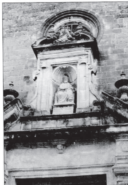
Detalle Portada Principal parroquia S. Marcos, Jerez Fra. año 1613

No deseamos levantar suspicacias ni susceptibilidades, que nos consta han surgido entre los investigadores profesionales, tan sólo queremos alentar el interés general en estas materias, evitando en lo posible la conciencia aletargada de nuestra ciudad, y favorecer el conocimiento, respeto y defensa de nuestro hoy maltrecho patrimonio histórico – artístico.