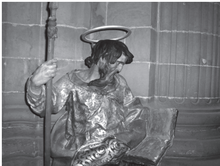
3. Santo Tomás, 1637-39. Jerez, Catedral