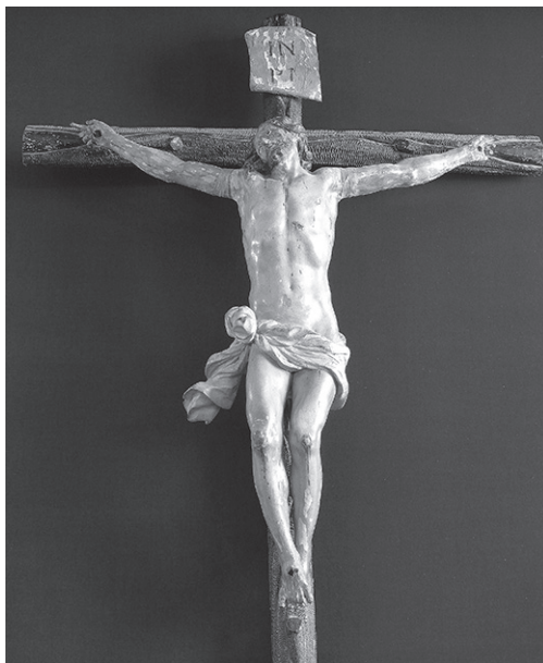
9. Crucificado, h. 1648. Jerez, Iglesia de Las Angustias