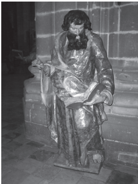
1. San Simón, fechado en 1639. Jerez, Catedral