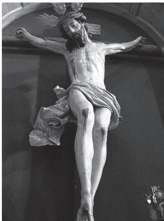
8. Santo crucifijo de la Salud, 1647