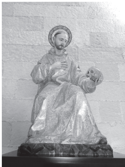
5. San Bruno de Colonia, 1641. Jerez, Catedral