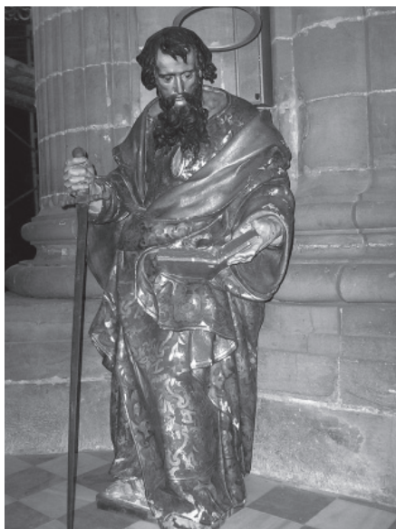
2. San Pablo, 1637-39. Jerez, Catedral