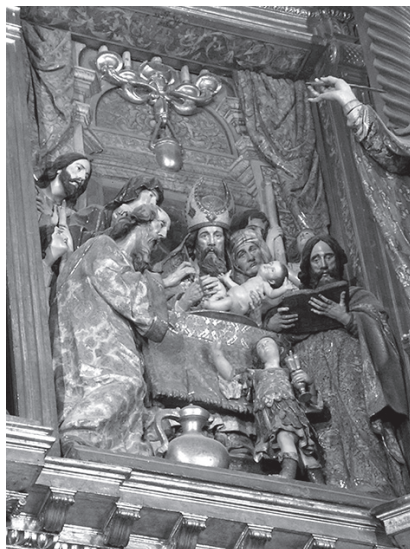
7. Relieve de la Circuncisión, 1641-44